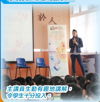
主講員生動有趣地講解，令學生十分投入。