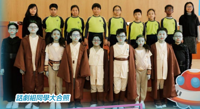
話劇組同學大合照