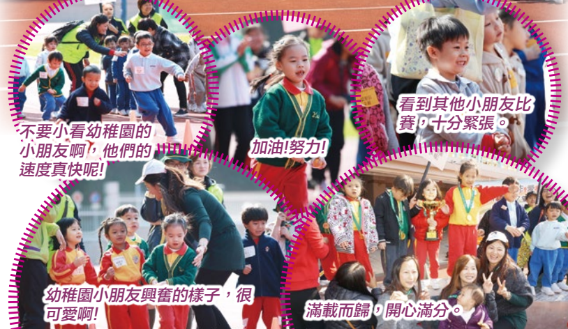
不要小看幼稚園的小朋友啊，他們的速度真快呢!