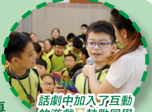
話劇中加入了互動的遊戲，鼓勵同學思考生命的價值。

香港離島區各界協會主辦、香港話劇團合辦，並由華人永遠墳場管理委員會贊助—2016生命教育計劃《活著真好！》話劇巡迴表演及工作坊，已分別於2016年11月8日及2016年12月12日在本校雨天操場舉行，我們盼望學生們能牢記着話劇中所傳遞的訊息，讓他們有一份正能量去面對人生的每一個挑戰。