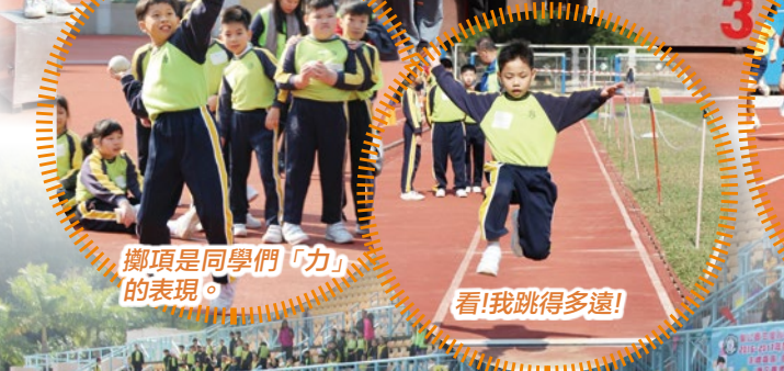
擲項是同學們「力」的表現。