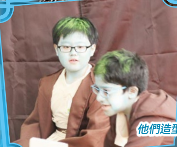
他們造型有趣，表現良好!