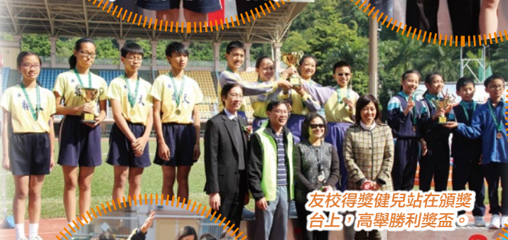
友校得獎健兒站在頒獎台上，高舉勝利獎盃。