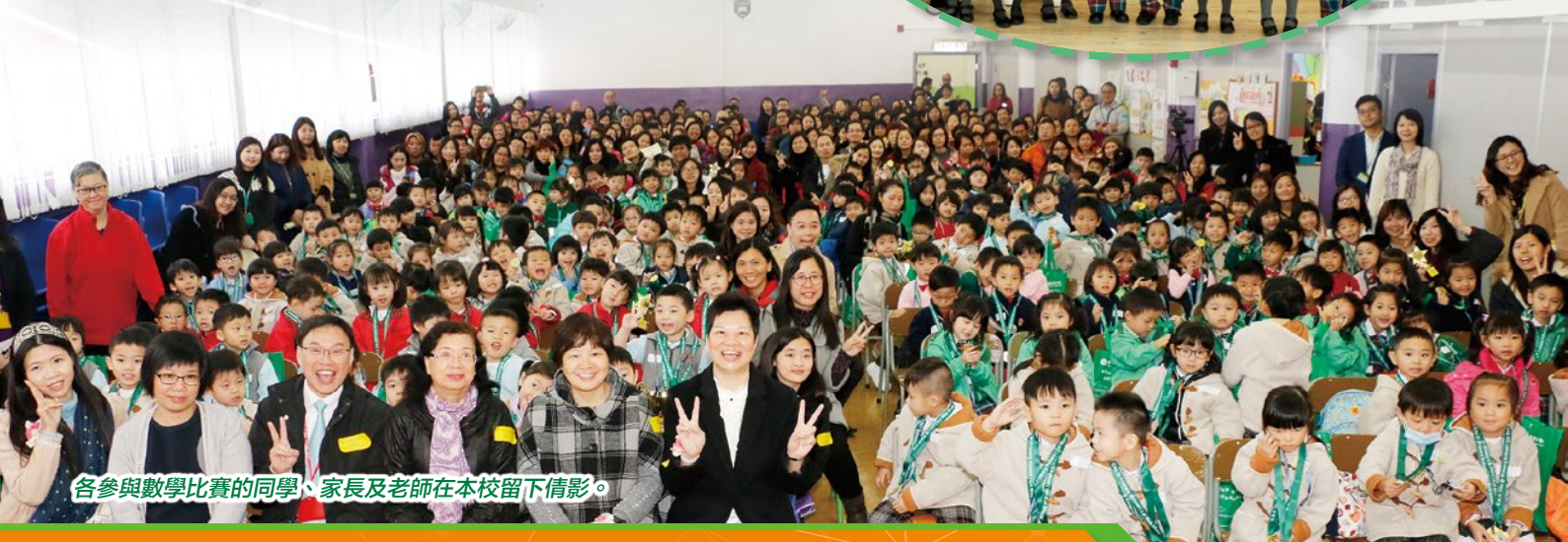
各參與數學比賽的同學、家長及老師在本校留下倩影。