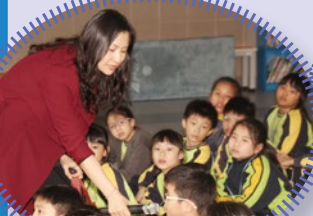
講者讓學生發表對店舖盜竊的看法，學生踴躍發言。