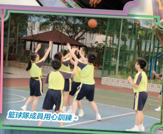
籃球隊成員用心訓練。