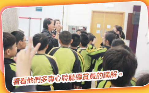
看看他們多專心聆聽導賞員的講解。

視藝科為配合教學目標，安排了小二及小四學生參觀「粵劇主題」和「衣+包剪掙」的藝術館，發展學生視覺認知和共通能力，擴展學生在藝術方面的視野。