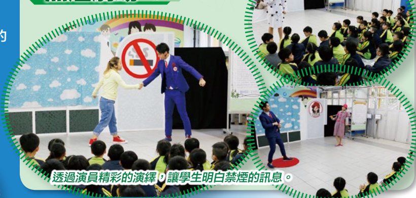
透過演員精彩的演繹，讓學生明白禁煙的訊息。