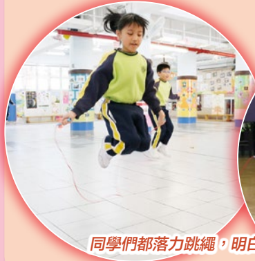
同學們都落力跳繩，明白運動的重要。