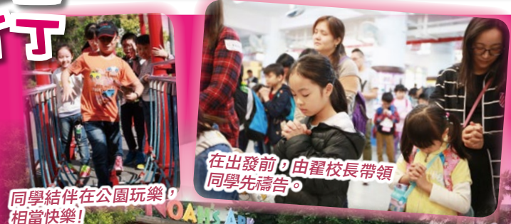
同學結伴在公園玩樂，相當快樂！

2016年12月4日(星期日)，本校家教會舉辦親子旅行活動。當天，300名家長及學生連同老師及翟校長，浩浩蕩蕩出發到挪亞方舟。抵達目的地後，大家首先參與由場地舉辦的親子遊戲，享受親子之樂。之後是自由活動時間，各個家庭可以自由選擇有興趣的展覽館等。最後大家一同享受自助餐，大家均興盡而返，好好享受了這愉快的親子日。