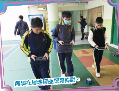
同學在場地積極認真備戰。