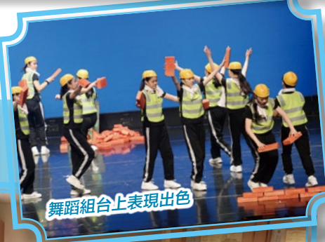
舞蹈組合上表現出色