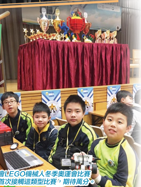
聖公會LEGO機械人冬季奧運會比賽，同學首次接觸這類型比賽，期待萬分。