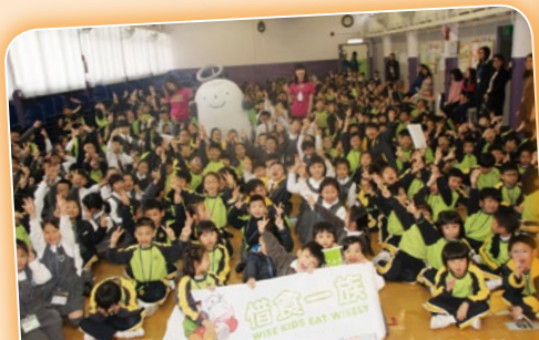
講座透過手偶劇、影片和問答遊戲，讓學生了解香港食物浪費情況及珍惜食物的方法。