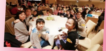
雖然只是一頓簡單的午餐，卻盛載着同學們的濃情。