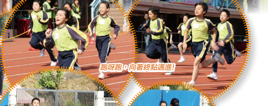
跑呀跑，向著終點邁進!