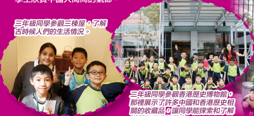
三年級同學參觀香港歷史博物館，那裡展示了许多中國和香港歷史相關的收藏品，讓同學能探索和了解中國和香港的歷史。