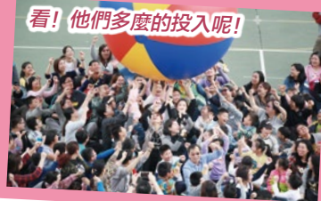
看！他們多麼的投入呢！