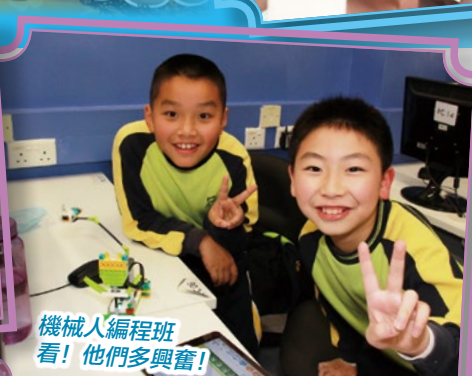
機械人編程班看! 他們多興奮!