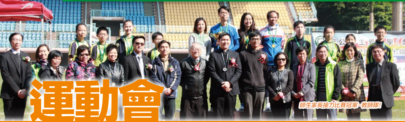
師生家長接力比賽冠軍—教師隊!