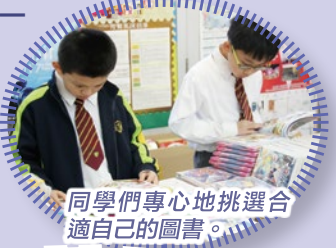
同學們專心地挑選合適自己的圖書。