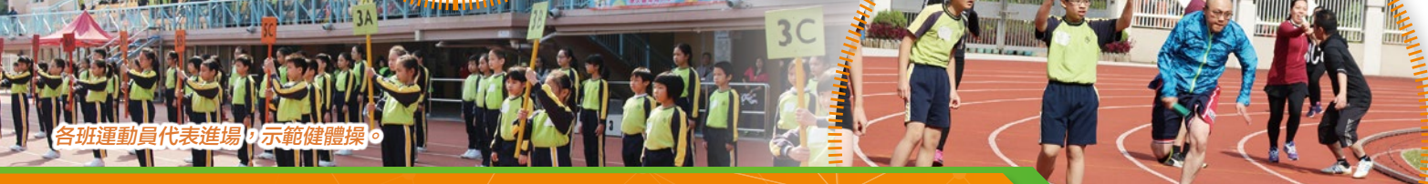
各班運動員代表進場，示範健體操。