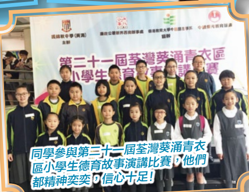
同學參與第三十一屆荃灣葵涌青衣區小學生德育故事演講比賽，他們都精神奕奕，信心十足!