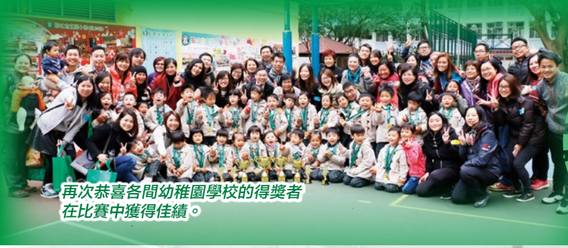
再次恭喜各間幼稚園學校的得獎者在比賽中獲得佳績。