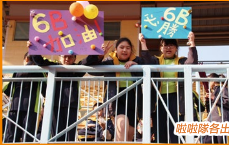
啦啦隊各出其謀為健兒打氣。