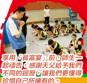
享用「貧富宴」前，師生一起禱告，感謝天父給予我們不同的經歷，讓我們更懂得珍惜自己所擁有的。