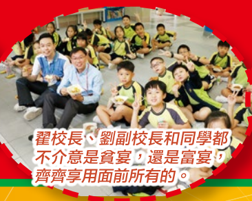
翟校長、劉副校長和同學都不介意是貧宴，還是富宴，齊齊享用面前所有的。