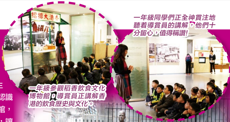
一年級同學們正全神貫注地聽着導賞員的講解，他們十分留心，值得稱讚！

為了培養學生的愛國精神，增加他們對祖國的歸屬感，本年度常識科的專題研習以「認識中國」為母題，各級就自己所定的子題進行研習活動。而本年度的教育性參觀亦與專題研習結合，參觀有關祖國的展館，讓學生能親身搜集資料，如一年級參觀稻香飲食文化博物館，認識中國的飲食文化及傳統美食；三年級參觀三棟屋博物館，了解古時候人們的生活情況；五年級參觀孫中山紀念館，讓學生欣賞中國人高尚的氣節。