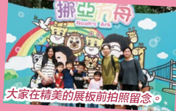
大家在精美的展板前拍照留念。