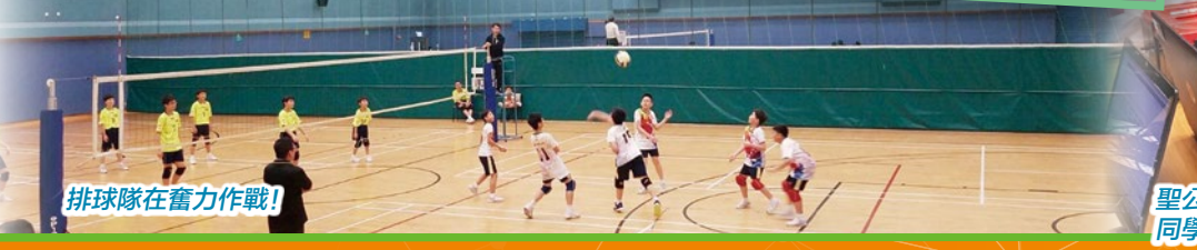
排球隊在奮力作戰!