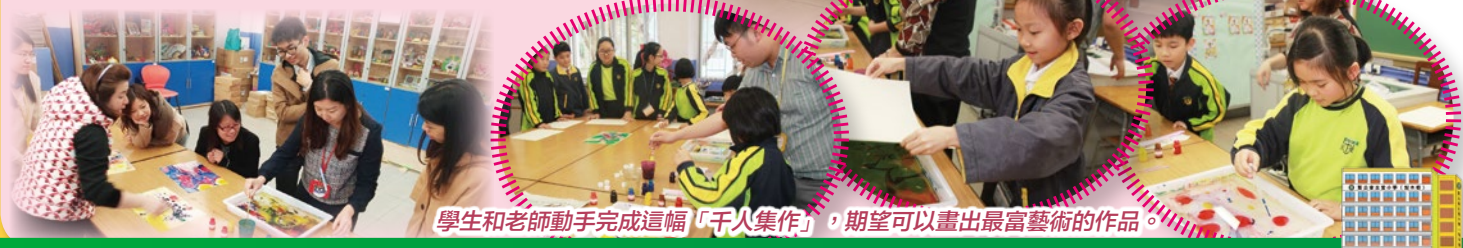
學生和老師動手完成這幅「千人集作」，希望可以畫出最富藝術的作品。