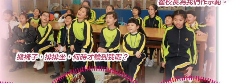
擔椅子，排排坐，何時才輪到我呢？