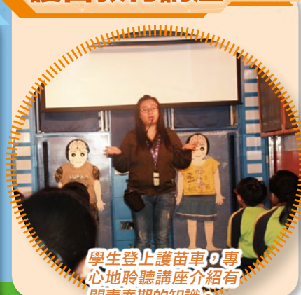
學生登上護苗車，專心地聆聽講座介紹有關青春期的知識。