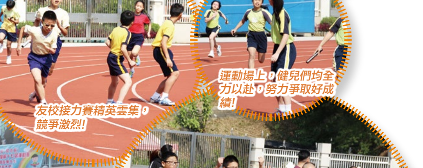
友校接力賽精英雲集，競爭激烈!