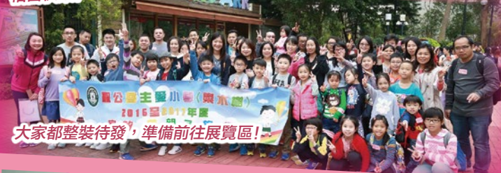
大家都整裝待發，準備前往展覽區！