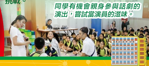
同學有機會親身參與話劇的演出，嘗試當演員的滋味。