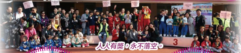
人人有獎，永不落空。