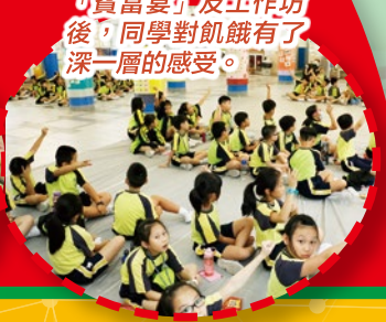
「貧富宴」及工作坊後，同學對飢餓有了深一層的感受。