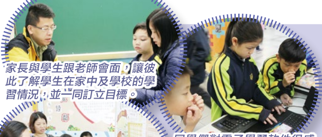
家長與學生跟老師會面，讓彼此了解學生在家中及學校的學習情況，並一同訂立目標。

本年度的家長日於2017年2月17日(星期五)舉行。當天，家長與學生一同到來跟老師會面，在會談中了解學生的學習情況，又共同訂定一些目標，達致家校合作。另外，學校於當天安排了學生作品展，展示各科的學生佳作，家長可一同分享子女的學習成果；本年度學校更增設了學生成績捷報，展示同學的佳績；又安排書展，讓家長與學生一同選購各類圖書及電子學習教材。