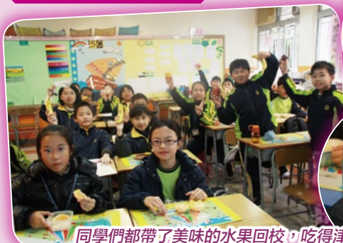
同學們都帶了美味的水果回校，吃得津津有味！