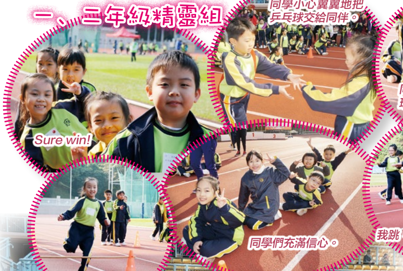
同學小心翼翼地將乒乓球交給同伴。