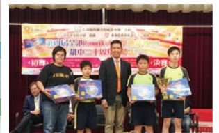
第四屆全港Rummikub小學邀請賽團體總冠軍