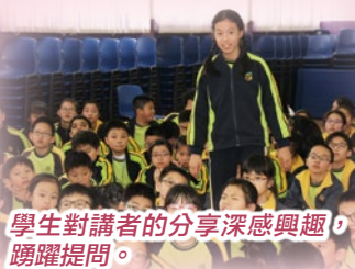
學生對講者的分享深感興趣，踴躍提問。