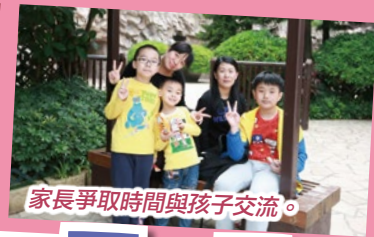
家長爭取時間與孩子交流。