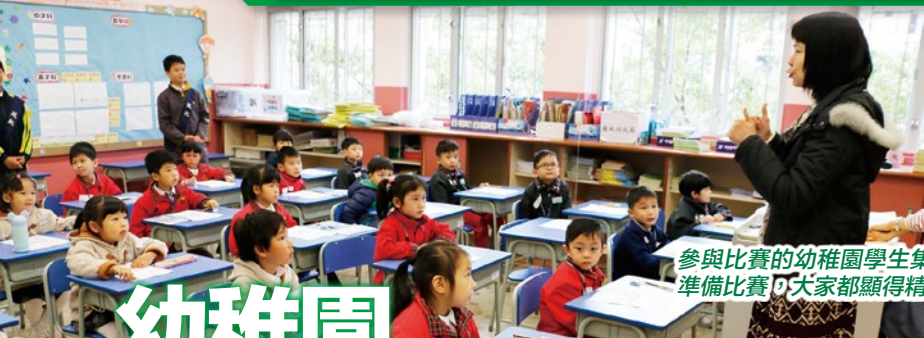
參與比賽的幼稚園學生集隊上班房準備比賽，大家都顯得精神奕奕。