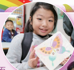
看！他們的手工藝多漂亮！

2015年12月6日(星期日)，本校家教會舉辦親子旅行活動。當天，300多名家長及學生連同老師及副校長，浩浩蕩蕩出發到保良局賽馬會大棠渡假村。抵達營地後，大家首先參與學校為各級安排的親子遊戲，讓大家享受親子之樂。之後是自由活動時間，各個家庭可以自由選擇有興趣的活動，如射箭、康樂棋、繩網陣、環保手工藝、踏單車、彈網、攀石及攀樹等。大家均興盡而返，好好享受了這愉快的親子日。