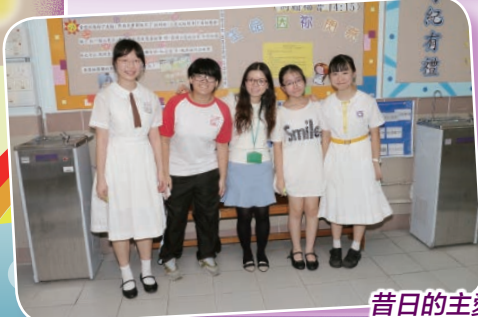
昔日的主愛(梨木樹)舊生，如今都穿上不同的中學校服，邁向人生新階段。