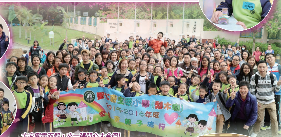
大家興盡而歸，來一張開心大合照！