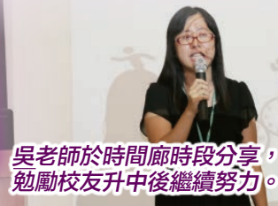
吳老師於時間廊時段分享，勉勵校友升中後繼續努力。