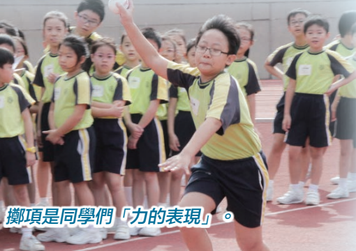
擲項是同學們「力的表現」。