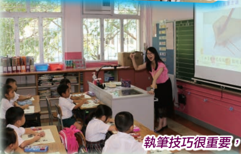
執筆技巧很重要，寫字姿勢要正確！