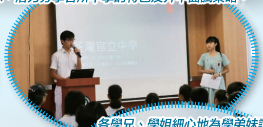
各學兄、學姐細心地為學弟妹講解學校特色及分享中學生活點滴。