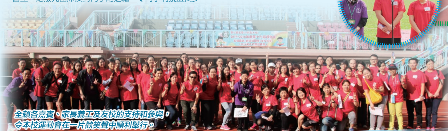
全賴各嘉賓、家長義工及友校的支持和參與，令本校運動會在一片歡笑聲中順利舉行。