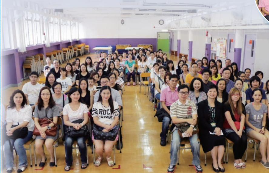
家長參與家長會，關心子女在校的學習情況。