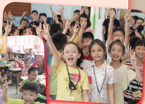
同學可以穿著便服回校，大家當日的情緒都十分高漲。