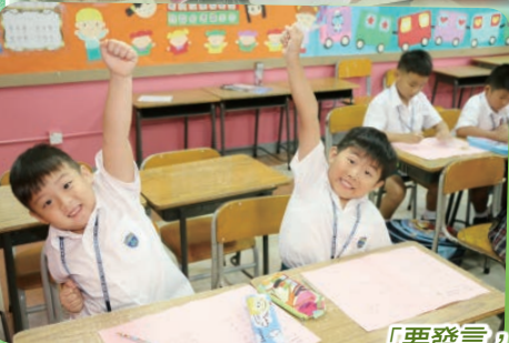
「要發言，先舉手」同學們都做得好！

我覺得這三天能夠給我好好準備小學的生活，學習小學的上課形式，以及早些認識班上的老師和同學。