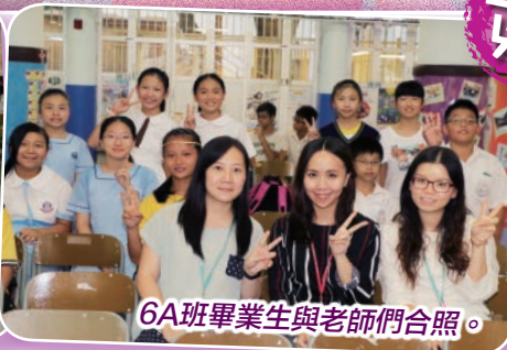
6A班畢業生與老師們合照。