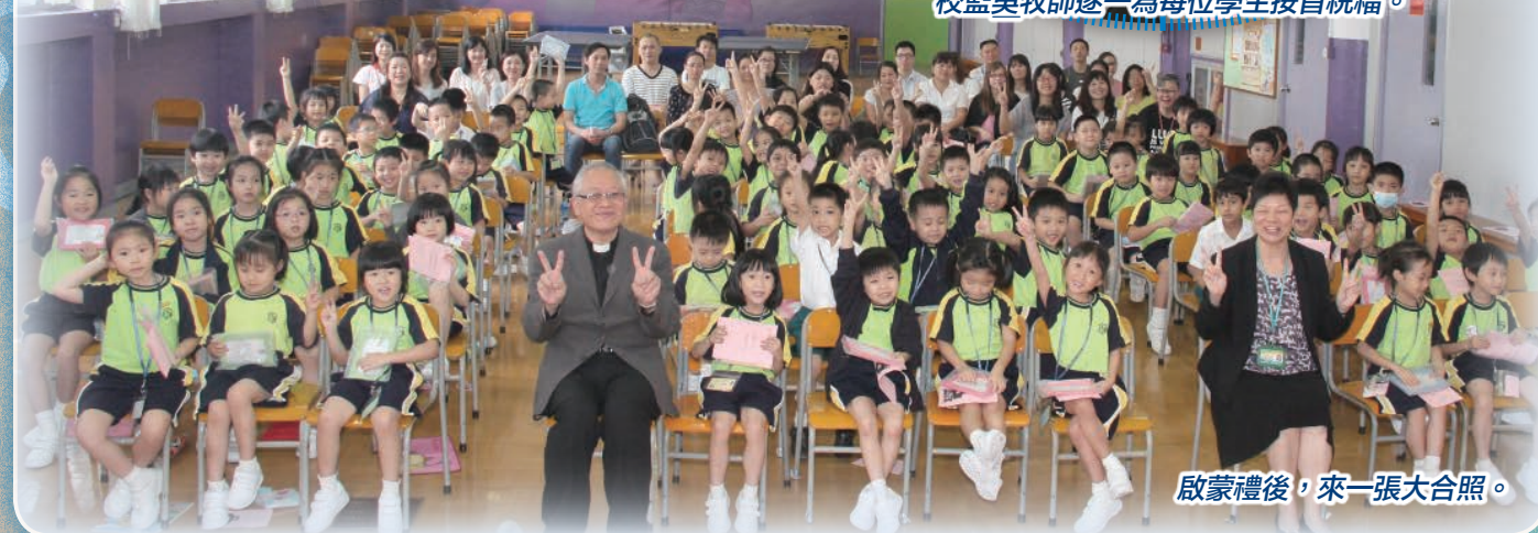
啟蒙禮後，來一張大合照。