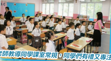
老師教導同學課室常規，同學們有禮又專注。