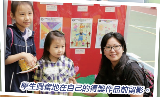
學生興奮地在自己的得獎作品前留影。