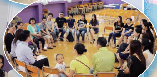
老師向六年級家長講解升中的注意事項，家長專心地聆聽。