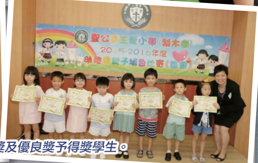
鄺校長頒發優異獎及優良獎予得獎學生。