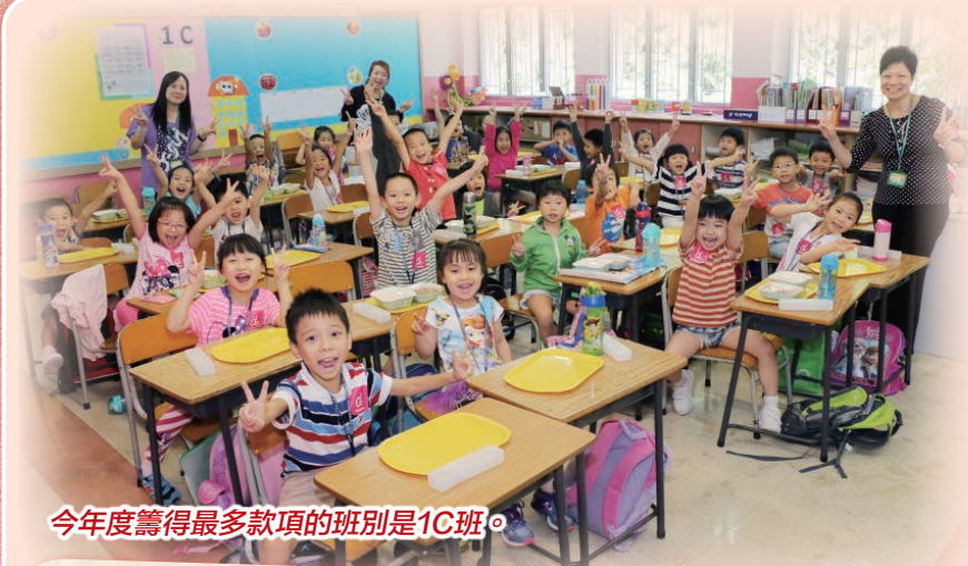
今年度籌得最多款項的班別是1C班。

本校於2015年10月8日(星期四)舉行「公益金便服日」籌款活動。是次籌款目的乃為資助社會福利服務，使本校學生能培養主動關心和幫助他人的品德。本校得到家長和學生鼎力支持，熱心參與捐助，共籌得港幣$15,225。