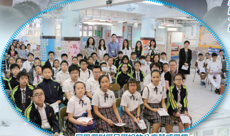
同學們對學兄學姐的分享甚感興趣，大家均表示十分受用呢！