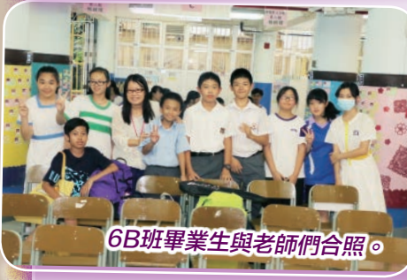
6B班畢業生與老師們合照。