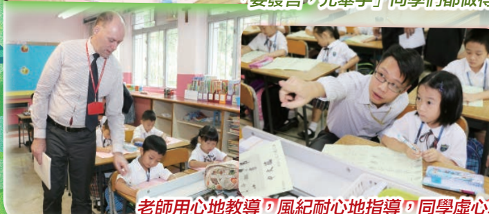
老師用心地教導，風紀耐心地指導，同學虛心地學習。