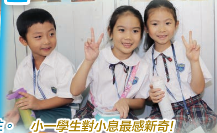
小一學生對小息最感新奇！