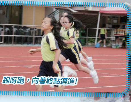
跑呀跑，向著終點邁進！