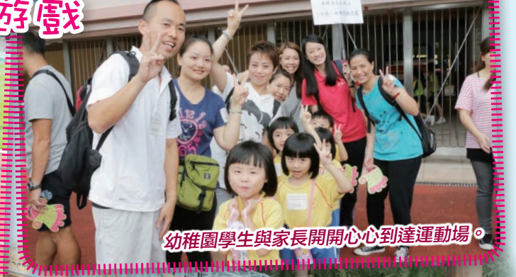
幼稚園學生與家長开开心心到達運動場。