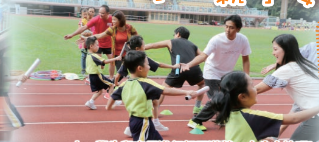
小一學生與家長進行親子遊戲，十分合拍呢！