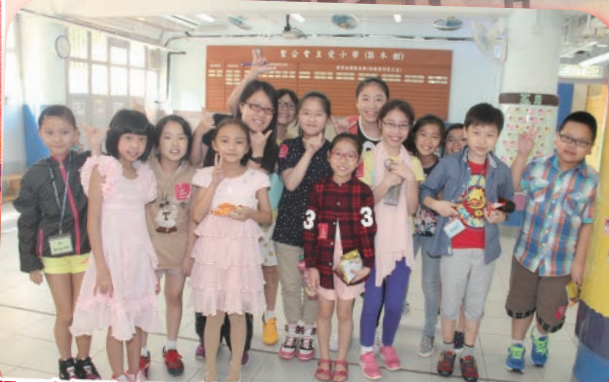
既可穿便服，又可幫助他人，同學們均表現得十分興奮。