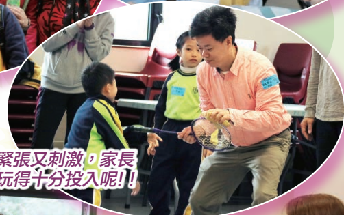
親子遊戲緊張又刺激，家長與同學均玩得十分投入呢！！