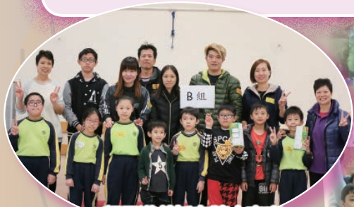
親子遊戲旨在讓大家享受親子樂，不分輸贏。