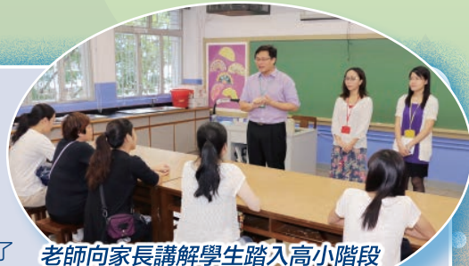
老師向家長講解學生踏入高小階段所遇到的問題，為家長解除疑慮。

一年一度的家長會已圓滿結束。在九月份各級舉行家長會，家長會當天，家長到來學校，細心地聆聽老師講述同學在校內的學習情況，讓家長了解學生們的校園生活點滴，而家長亦樂於透過是次會面，與老師分享子女在家的學習情況及習慣，互相溝通協調。家長的積極參與，能促進家校的合作聯繫，攜手提升學生的學習效能。