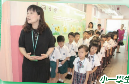
小一學生秩序井然，守紀又有禮，表現令人讚不絕口。