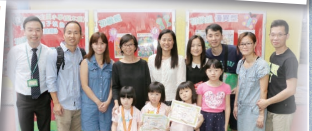
劉副校長(左一)與得獎學生在得獎作品展板前合照。