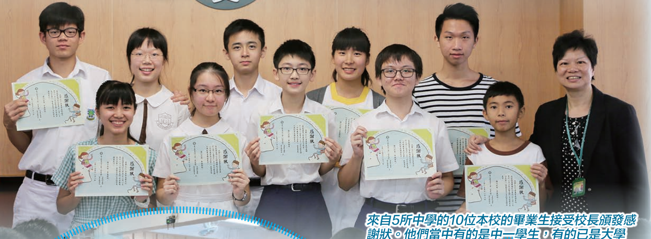
來自5所中學的10位本校的畢業生接受校長頒發感謝狀。他們當中有的是中一學生，有的已是大學一年級的醫科生。大家為了本屆六年級的師弟師妹，落力分享各所中學的特色及升中面試策略。