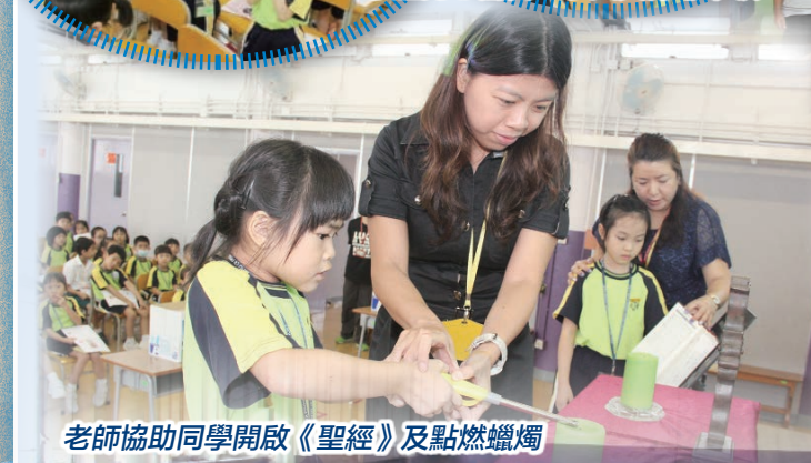
老師協助同學開啟《聖經》及點燃蠟燭