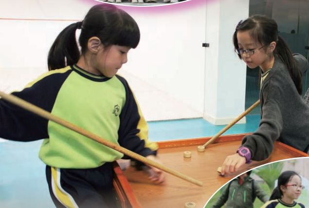
營地內有各式各樣的康樂活動，令同學們興奮不已。