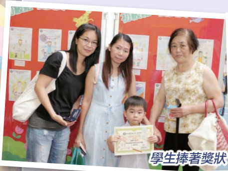
學生捧著獎狀，一臉滿足。