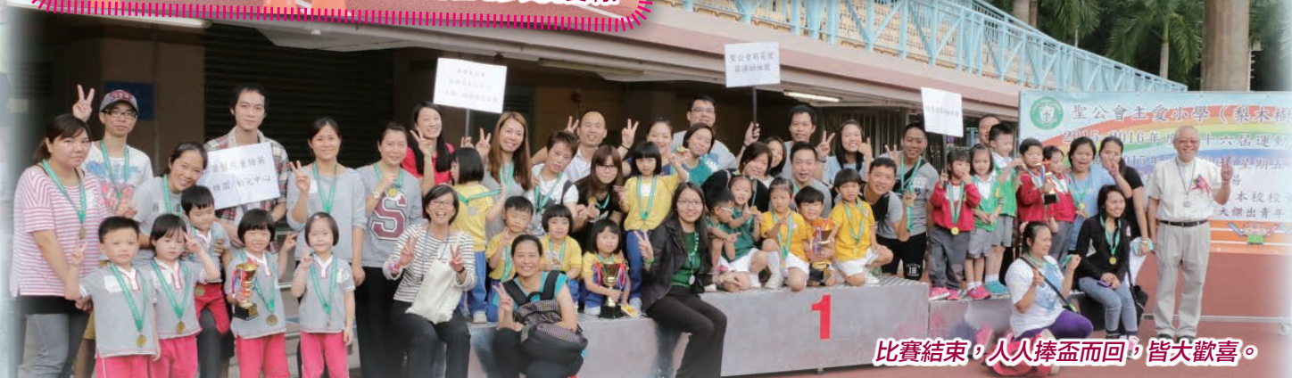
比賽結束，人人捧盃而回，皆大歡喜。