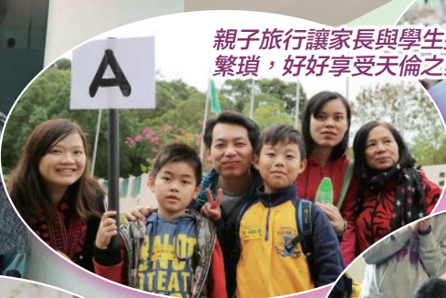
親子旅行讓家長與學生拋開繁瑣，好好享受天倫之樂。