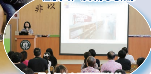
鍾主任向家長講解學校於新學年作出的新安排。