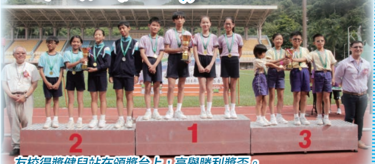
友校得獎健兒站在頒獎台上，高舉勝利獎盃。