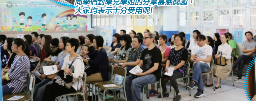
當天有40多位家長陪同子女蒞臨參加「升中分享會」，細心聆聽舊生講解各間中學的特色。