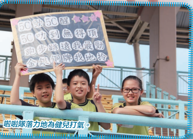
啦啦隊落力地為健兒打氣。