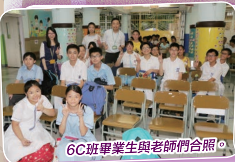
6C班畢業生與老師們合照。

本校於2015年9月25日舉行「2014-2015年度畢業生黃昏小聚」，校友們均踴躍支持是次聚會，不少同學待現就讀學校活動完畢，馬上趕來母校與舊同學重聚。聚會上，校友們與老師和同學分享升中後的點點滴滴，氣氛溫馨愉快。