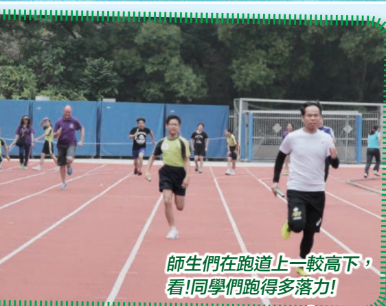
師生們在跑道上一較高下，看！同學們跑得多落力！