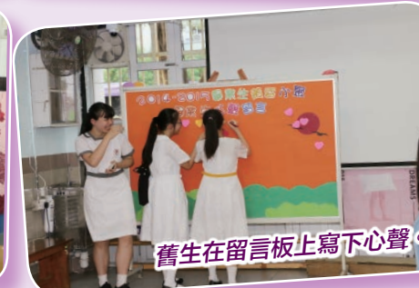
舊生在留言板上寫下心聲。