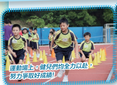
運動場上，健兒們均全力以赴，努力爭取好成績！