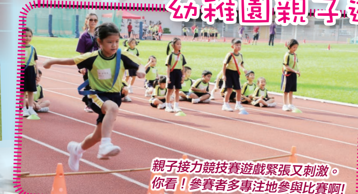
親子接力競技賽遊戲緊張又刺激。你看！參賽者多專注地參與比賽啊！