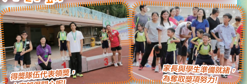
得獎隊伍代表領獎，大家都很开心呢！