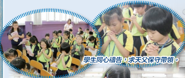
學生同心禱告，求天父保守帶領。